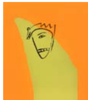
55 Med tennene serigrafi 1/1 pris: 4.000,- m/r