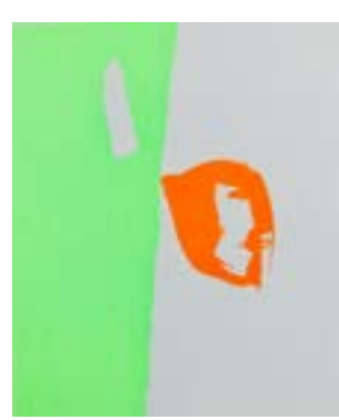
67 Valgene serigrafi 1/1 pris: 4.000,- m/r