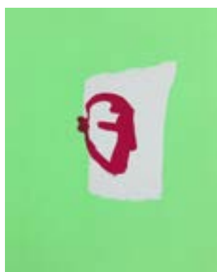
49 Innover rødt