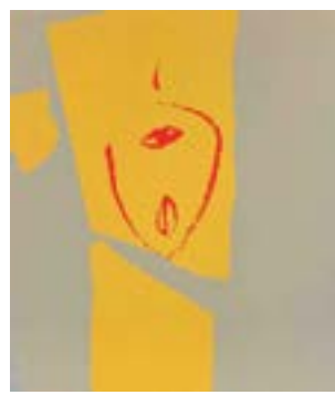
66 Tidlig men sant serigrafi 1/1 pris: 4.000,- m/r