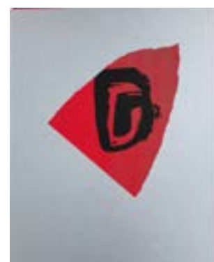
43 Hode 13