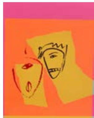
57 Møtet serigrafi 1/1 pris: 4.000,- m/r