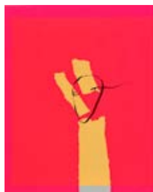
42 Faren er over