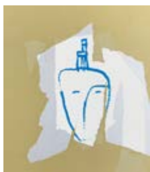
45 Hode med stol