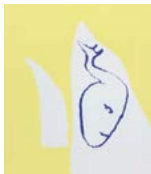
61 Se opp se ned ja serigrafi 1/1 pris: 4.000,- m/r