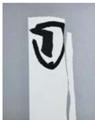
58 Mye bedre enn før takk serigrafi 1/1 pris: 4.000,- m/r