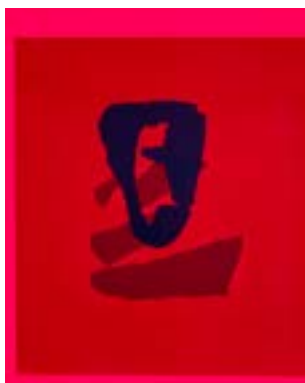
46 Hva tenkte du da?