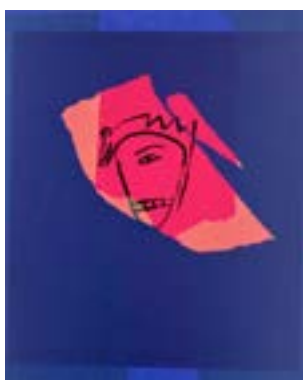
64 Smile med tennene serigrafi 1/1 pris: 4.000,- m/r