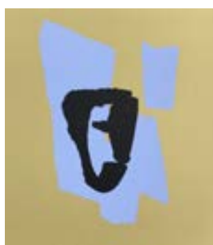
48 I could kiss you