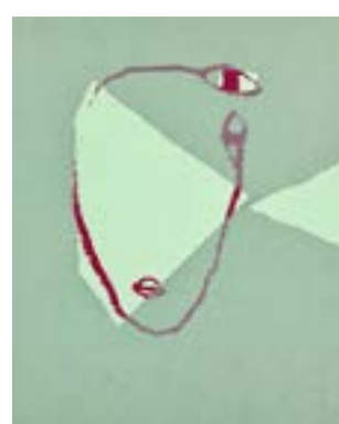
59 Øye for øye serigrafi 1/1 pris: 4.000,- m/r