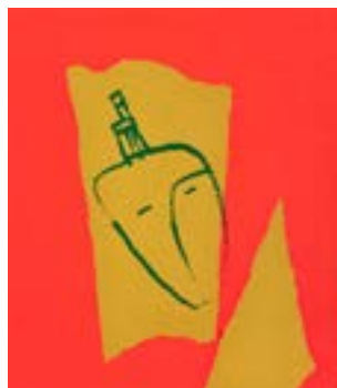
53 Med stol sitt serigrafi 1/1 pris: 4.000,- m/r