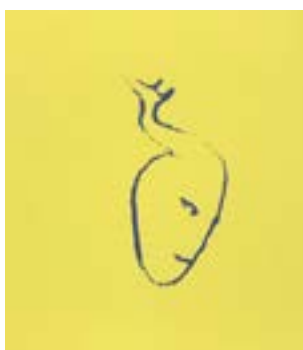
60 Se opp se ned fordi serigrafi 1/1 pris: 4.000,- m/r