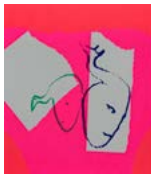
62 Se opp se ned serigrafi 1/1 pris: 4.000,- m/r