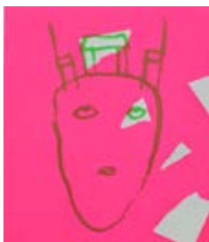
56 Møblert serigrafi 1/1 pris: 4.000,- m/r