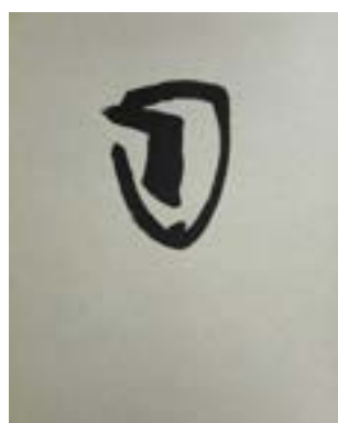
41 Hode 8