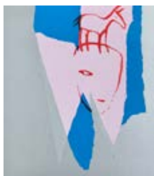
44 Hode med hest