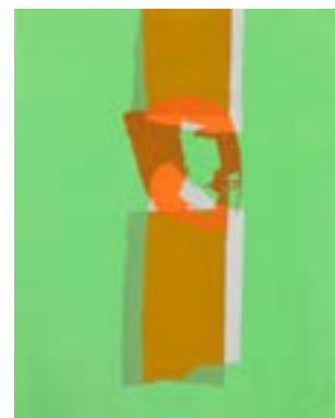
63 Ser etter serigrafi 1/1 pris: 4.000,- m/r