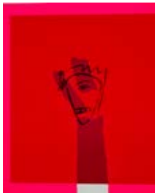
65 Smiler og smiler serigrafi 1/1 pris: 4.000,- m/r