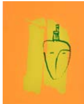
54 Med stol serigrafi 1/1 pris: 4.000,- m/r